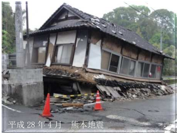
平成 28 年 4 月 熊本地震