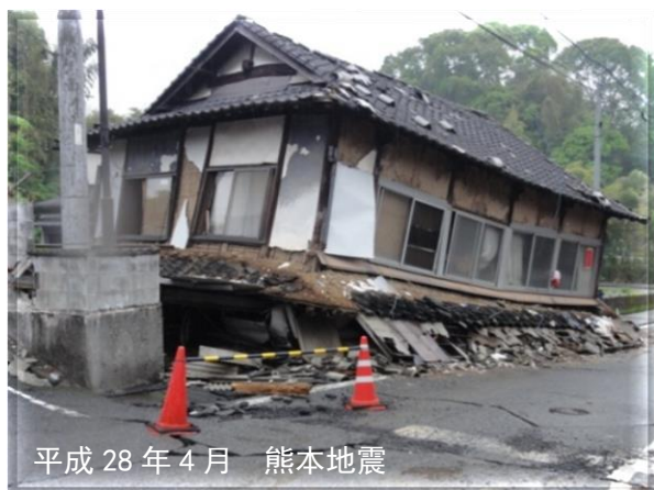
平成28年4月 熊本地震